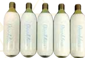
碳酸小型气体可替换装